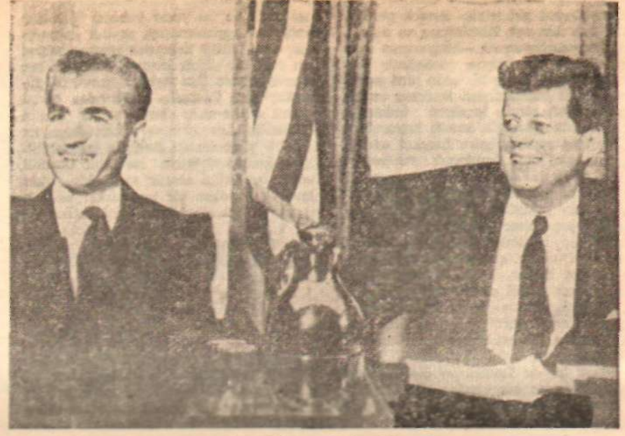
İran Şahı ve Başkan Kennedy «Yoksa komünist oluruz!..»

Hayber Han'ın son defa New York Yüksek Mahkemesi önünde verdiği ifadeye göre, Prenses Eşref'in kocası Çevik, bir gün ona gelir ve şunları söyler: «Ben bu arazinin bir kısmını alıyorum. Bir kısmını da sen alabilirsin.» Anlaşıldığına göre, Hilton işletmecileri bu araziyi gözüne kestirmişler ve yirmi beş yıllık bir sözleşmeyle kiralayıp burada pırl pırl bir modern otel inşa etmek istemektedir. Han'ın ifadesine göre, O, spor programı için hibe edilmiş olan arazinin bu şekilde elinden çekilip alınmak istenmesi kar-