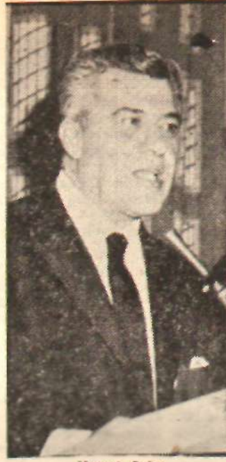
Kemal Satır Petrol şirketlerine ihtar

kasıdır. Petrol yüzünden adam öldürülür, hükümetler düşürülür. Seçim kazanmak için el altından paralar dağıtılır.