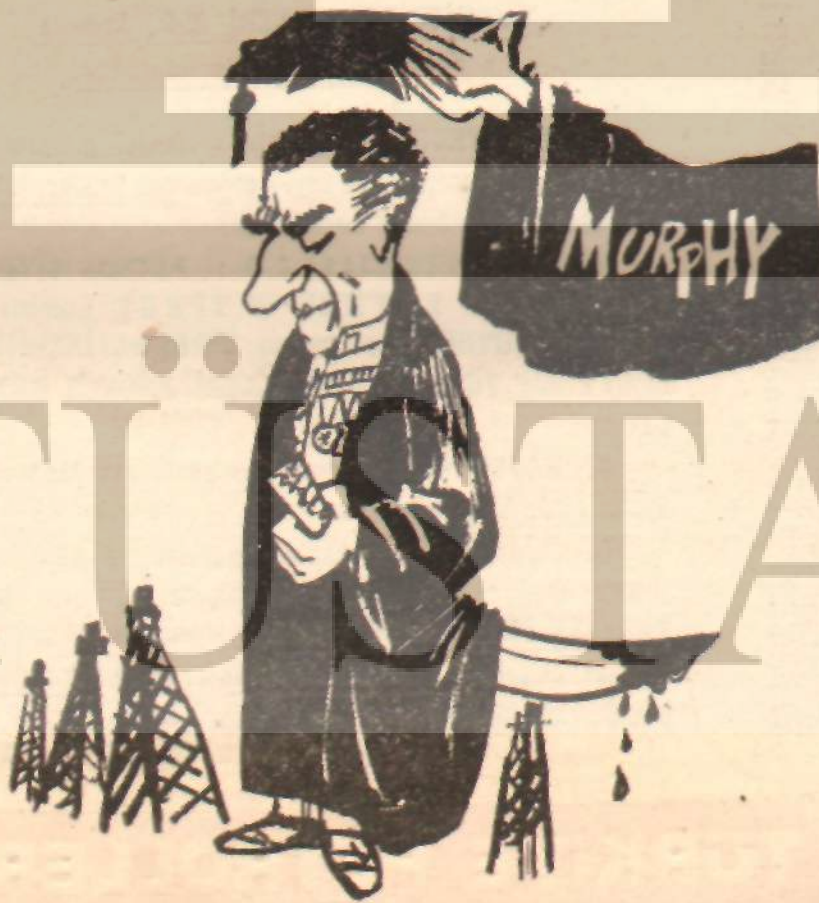
AMERİKA'NIN REFORMCU VE ANAYASACI HÜKÜMDARI

İki hafta sonra Ebtehaç tutuklandı. Bu hareket, H. H.'nin Cadillac'ında gizli bir ses kayıt cihazı bulunduğunu bilme-