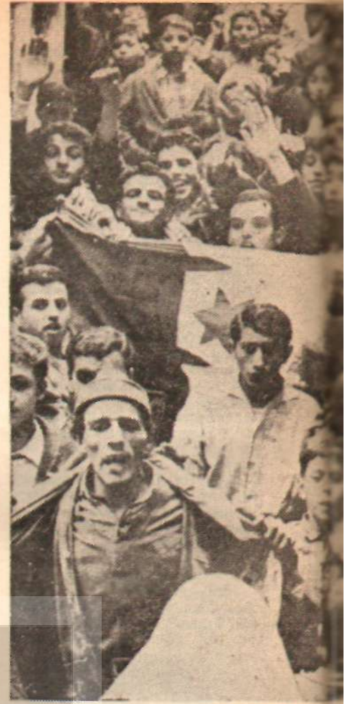
Cezayir halkı bir

Örneğin işletmelerin sadece kısa vâdeli rantabilite kistasından hareket ederek şu ya da bu ürünü tek taraflı olarak geliştirmeleri iyi bir şey olmazdı. Böyle bir durum denge-