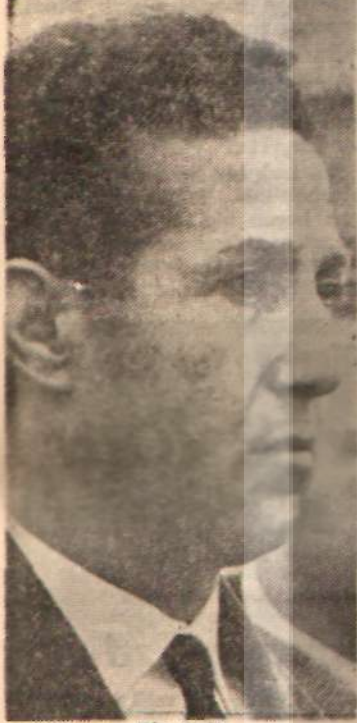
Bin Bella Destek ararken...

İhtilal Konseyi, birçok ülkenin tehir talebine rağmen, Asya — Afrika Konferansının gününde yapılabileceğini ısrarla belirtmektedir. Çin, Endonezya, Mısır gibi ön planda gelen ülkeler, konferansın tehirini uygun bulmaktadır. Konferansa katılma talebi, Çin'in ısrarıyla reddedilmesi beklenen Sovyetler Birliği de herhalde tehirden yanadır. Hatta General de Gaulle, yakınlarına Cezayir'deki gerilim Sovyetlerin parmağı bulunduğundan şüphelendiğini açıklamıştır! Türkiye ise, İngiliz Milletler Topluluğu üyelerinin dümen suyundan giderek, heyetimizin Cezayir'e hareketini geciktirmiştir. Halbuki yeni rejim yararına bir jest, bize hiç bir şey kaybettirmez, sadece prestij sağlar. Bununla beraber, Bandung'un on prensibinden habersiz olduğunu söyleyen Demirel başkanlığında konferansa katılmakansa, hiç katılmamak çok daha yararlıdır. Zira konferansda NATO üyeleri Amerika ve Portekiz'in Vietnam, Dominik Kongo ve Mozambik'teki davranışları en sert dille takbih edilecek, emperyalizme ve yeni sömürgecilğe ateş püskürtülecektir. Çömbel'in alınmadığı konferansa, Süleyman Demirel'in bu konudaki görüşleri her