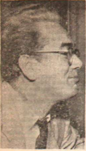
YABANCI SİRKETLERİN VE BAKANIN AGIZ BİRLİĞİ